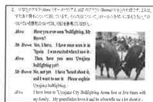
読解力を高めるシート