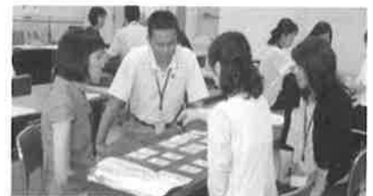
外国語指導力向上研修

中央研修を受講した教員が講師として、各管内で研修会を開催 回数：年3回×3管内＝計9回 対象：小学校：全小学校の中核教員 中学校：全英語担当教員