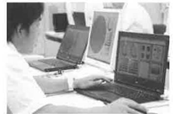
スキルアップ研修

対象：小学校教員（3年間で全小学校の情報教育担当教員が受講） 回数：年3回（年90名受講予定）8月2回、10月1回 内容：授業実践で役立つ実践事例の紹介や様々なプログラミングを体験 研修後のアンケートより 「研修内容を日々の教育活動で生かすことができる」 95%