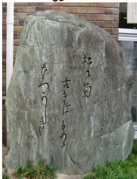
「松に菊 古きはもの なつかしき」(子規)