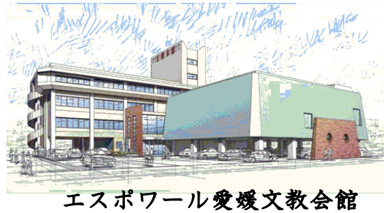
エスポワール愛媛文教会館